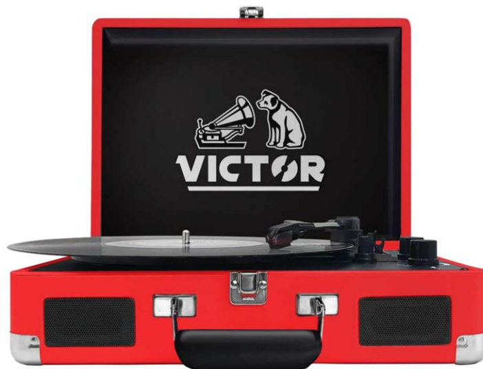
METRO DUAL BLUETOOTH SUITCASE (RED)