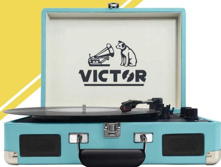
METRO DUAL BLUETOOTH SUITCASE (TURQUOISE)