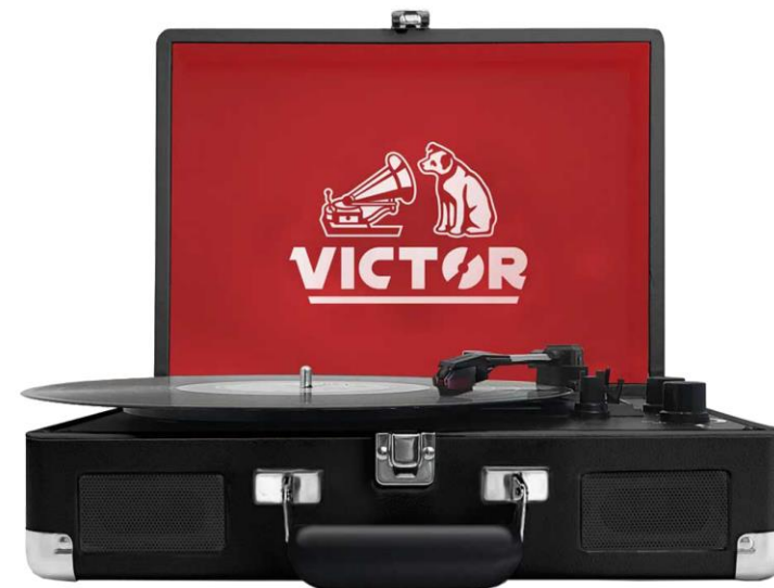
METRO DUAL BLUETOOTH SUITCASE (BLACK)